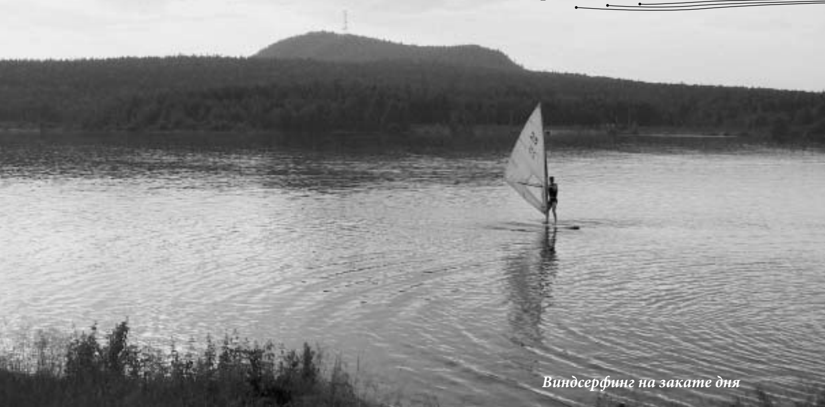
Виндсерфинг на закате дня

бленных помещениях. В каком состоянии на сегодняшний день находятся проекты строительства?