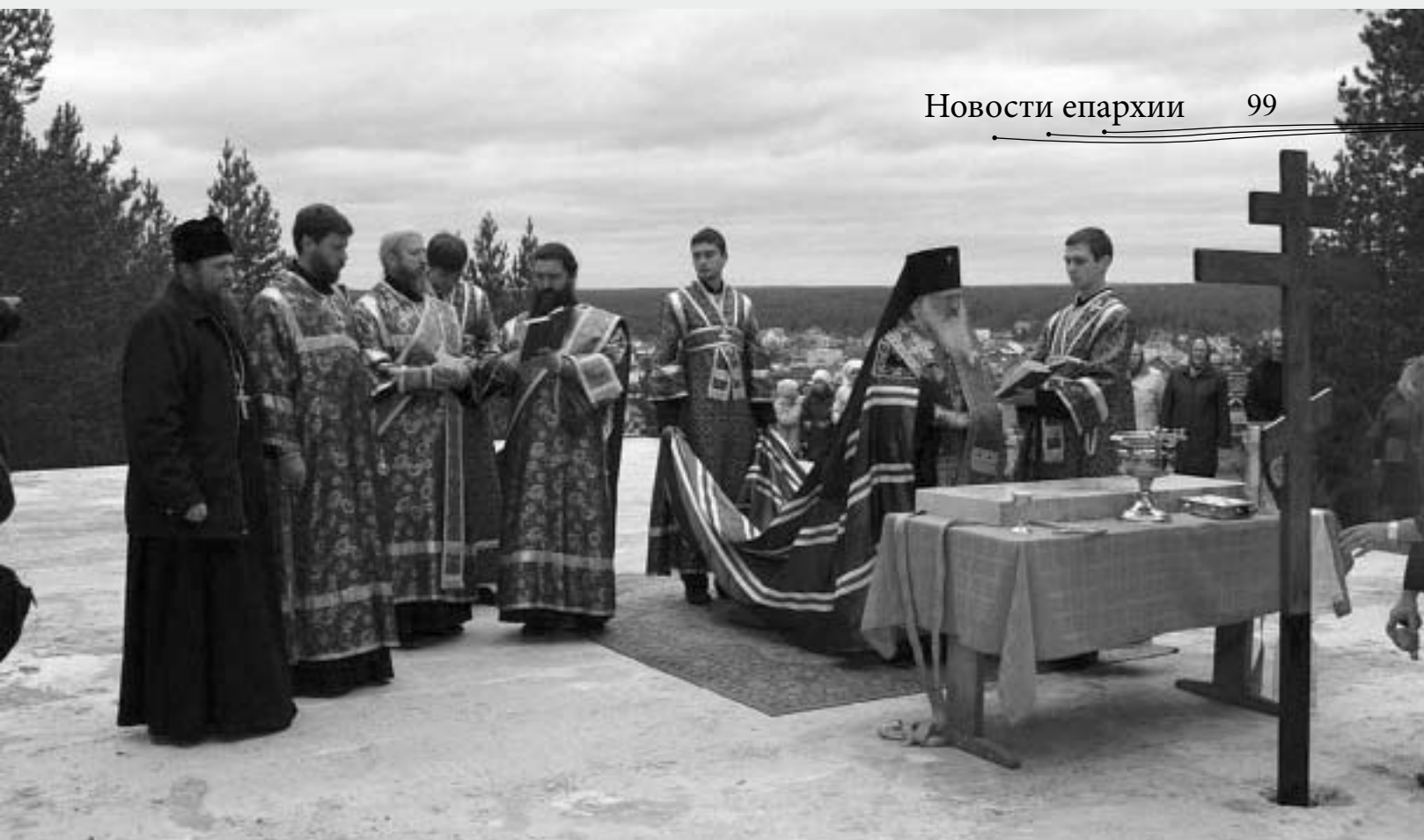
Архиепископ Екатеринбургский и Верхотурский Викентий осуществил закладку храма в честь Иконы Пресвятой Богородицы «Умягчение Злых Сердец» в Старопышминске.

Исполнилось 50 лет со дня священнической хиротонии одного из старейших клириков Екатеринбургской епархии митрофорного протоиерея Иоанна Осиповича. Многая и благая лета Вам, батюшка Иоанн!