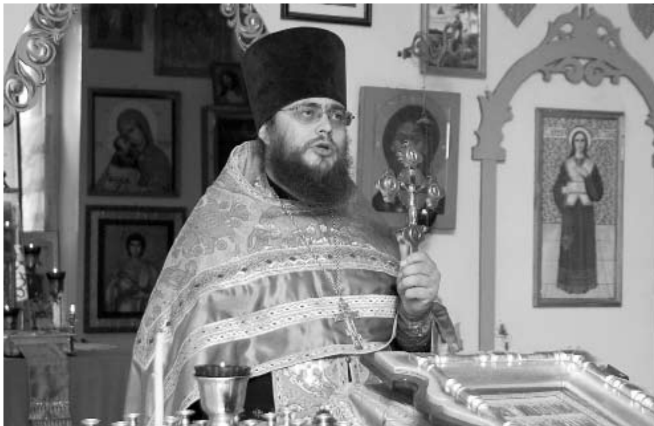
Проповедь в храме

— То есть, лошадьми Вы уже не занимаетесь?