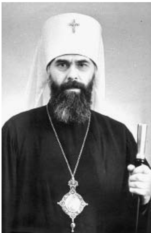
Митрополит Антоний Сурожский

28 ноября — 6 января — Рождественский пост