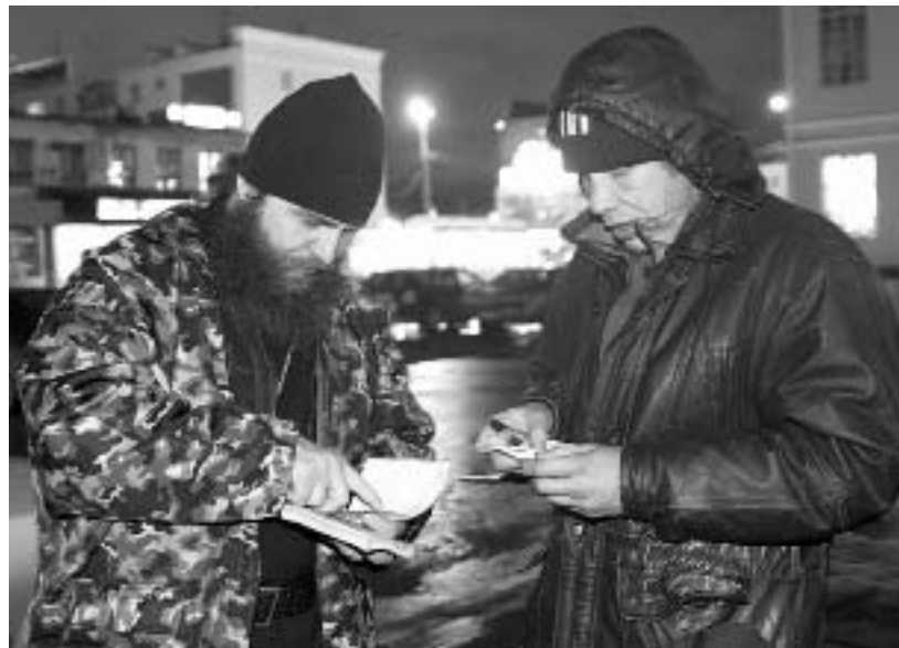
Работа на железнодорожном вокзале. Этот человек обратился за помощью впервые

Сейчас мы видим такую политику: бездомные — лишние люди. С одной стороны, это отношение государства, а с другой стороны — отношение простых людей: он сам во всем виноват, он пьяница и бездельник. Люди, думающие так, меняют местами причины и след-